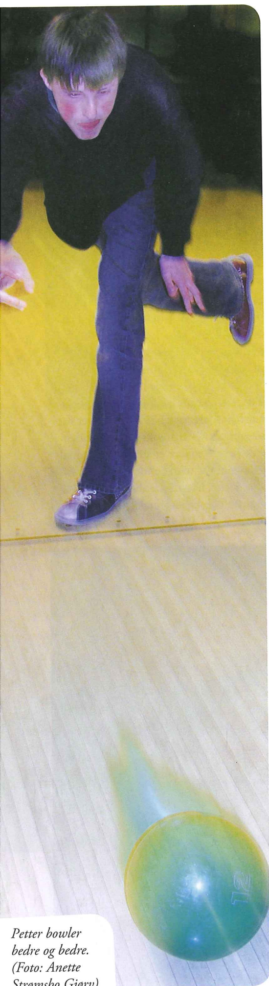
Petter bowler bedre og bedre.

for liten tro på hva utviklingshemmede kan være med på. Det kan også virke som om det hersker en slags tro på at de ikke har noe å gjøre på ordinære fritidsarenaer, tror Anders Midtsundstad.